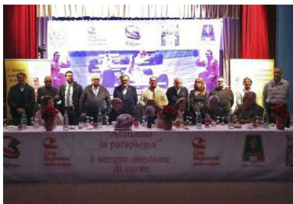
Due momenti della serata che si è svolta all'oratorio del quartiere San Bernardo

Si è svolto lo scorso 29 novembre, nella nuova cornice dell'oratorio San Bernardo di Lodi, il 32° "GP della solidarietà" in ricordo di Clay Regazzoni. L'appuntamento è ormai una tradizione di fine anno ed è il momento in cui il Club Clay Regazzoni (che raggruppa, fin dal 1993, appassionati di motori uniti dal comune obiettivo della solidarietà) devolve le somme dei proventi ricevuti a favore della ricerca scientifica in paraplegia, la grande "mission" lasciata in eredità dal pilota svizzero scomparso nel 2006, e che il Club porta avanti con successo da oltre 30 anni. In tutto questo periodo il sodalizio ha donato più di un milione di euro. Fino allo scorso anno il Gran Premio della solidarietà si svolgeva al ristorante Bocchi di Comazzo. All'oratorio San Bernardo, quest'anno, sono arrivati molti personaggi noti del mondo del Motorsport che si sono resi disponibili per domande ed autografi da parte del pubblico (oltre 150 sono state le persone sedute). Dopo un breve discorso di ben-